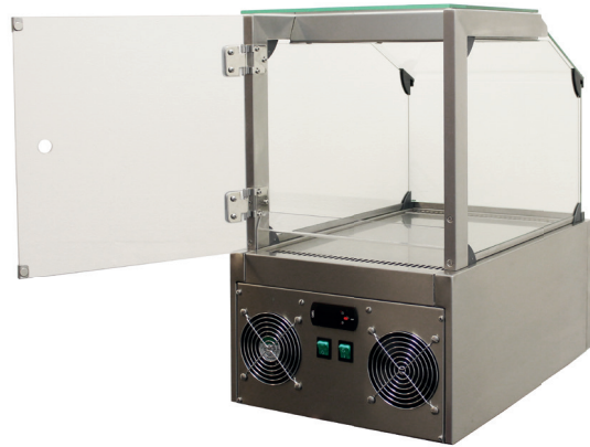
Rückansicht mit geöffneter Rückwandtüre und Steuerung