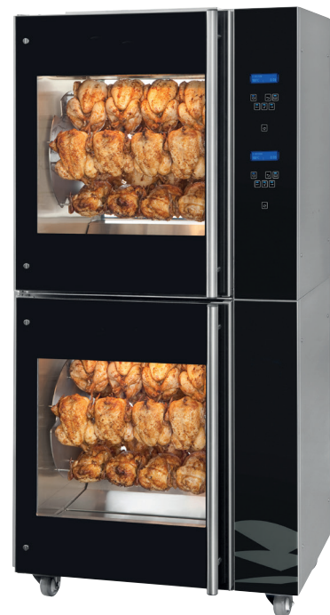
Rotinio 5P eco Kombi