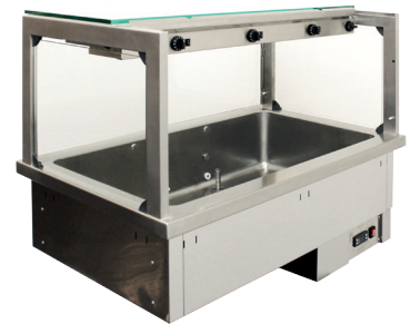
Rückansicht mit verstaumtem Schiebespiegel