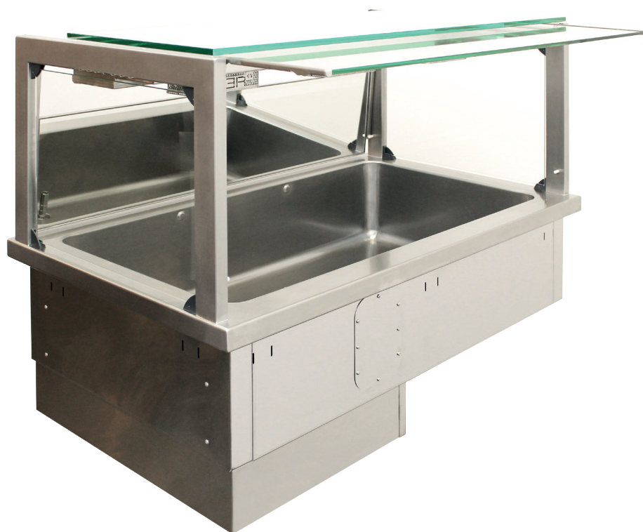
Vue de face: Vitre frontale ouverte servant de pare-haleine