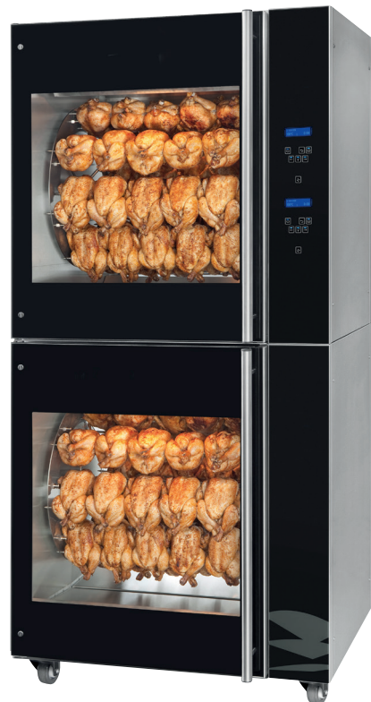
Rotinio 8P eco Combi

Vous trouverez d'autres accessoires sur notre liste de prix